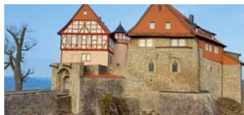
Burg Bodenstein

Maiferzeiten sind tolle Erlebnisse: Die romantisch-fantastische Burg mit Zugbrücke und hohen Wehrmauern, für den Krieg gebaut, soll nun eine Burg des Friedens werden, nach dem Motto: Schwerter zu Pflugscharen. In mittelalterlichen Kleidungen und ebensolchen Aktivitäten kann man die urtümliche Lebendigkeit dieser Zeit nacherleben, Feuer machen, singen, Brot backen, Fische fischen, im Rittersaal Aufführungen proben, Basteln, Turniere abhalten, Minnesang üben, Alchemie versuchen, geheimnisvolle Kräuter suchen und die ursprüngliche Natur des Eichs-