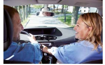
Carsharing - Wer sein Auto vermietet, sollte einige Dinge beachten.

ten auf eine der zahlreichen Carsharing-Plattformen zurück. „Diese fungieren als eine Art Vermittler und behalten dafür einen Teil der Gebühren ein“, erklärt Nickl. „Bei der Anmeldung müssen Autobesitzer:innen im Vorfeld Fahrzeugschein, Fahrzeugfotos, Informationen zum Fahrzeugzustand und zur möglichen Verfügbarkeit sowie den gewünschten Mietpreis einreichen.“ Im Anschluss können sich Miet-