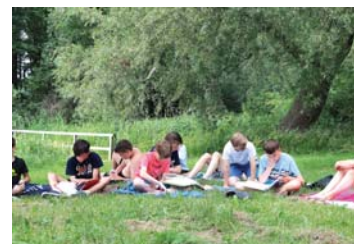
Konfirmandengruppe bei „harter Arbeit“ am Ratzeburger See im letzten Jahr.

Zur Anmeldung kommen Jugendliche im Alter von etwa 13 Jahren, möglichst in Begleitung eines Erziehungsberechtigten. Bitte Geburtsurkunde und – soweit vorhanden – die Taufurkunde mitbringen. Auch mögli-